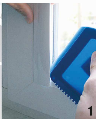
Abb. 1, 2:

Nehmen Sie einen Kunststoffschaber (z.B. einen Eiskratzer o.ä.) und drücken Sie diesen gemäß der Abbildungen vorsichtig entlang der Klebeflächen.