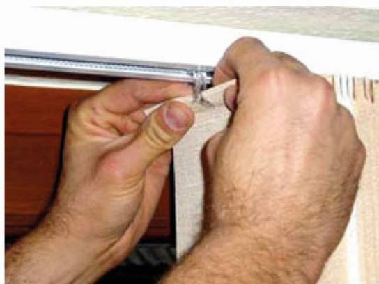
Abb. 14: Lamelle ankippen...