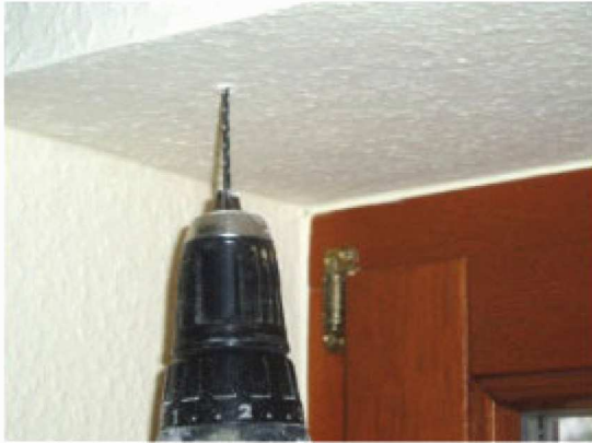
Abb. 4: ... und bohren