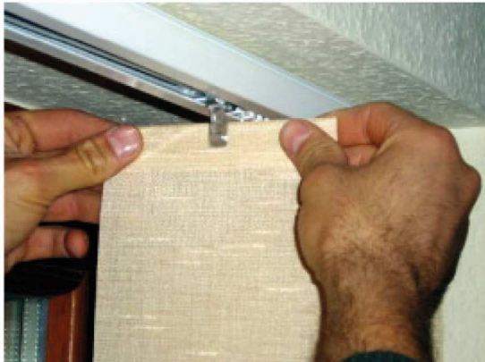
Abb. 9: Die Lamellen auf die Haken schieben