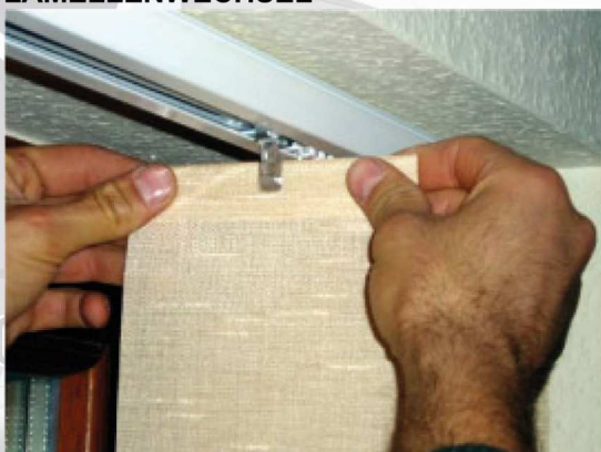
Abb. 13: Lamellenwechsel

Schritt 1: Zur Demontage und zum Auswechseln der Lamelle diese zunächst nach oben schieben