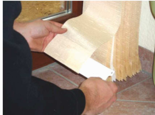
Abb. 10: Die Beschwerungsplatten in die Schlaufen einschieben