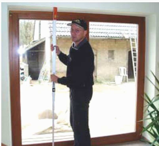
Abb. 1: Aufmass der lichten Breite in der Laibung

← Die Bestellhöhe ergibt sich aus der lichten Höhe abzüglich 30 mm