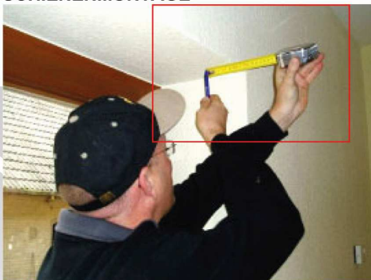
Abb.3: Bohrloch 70 mm von der Wand markieren...

← Die Bohrungen für die Befestigungsclips 70 mm von der Wandinnenkante anzeichnen.