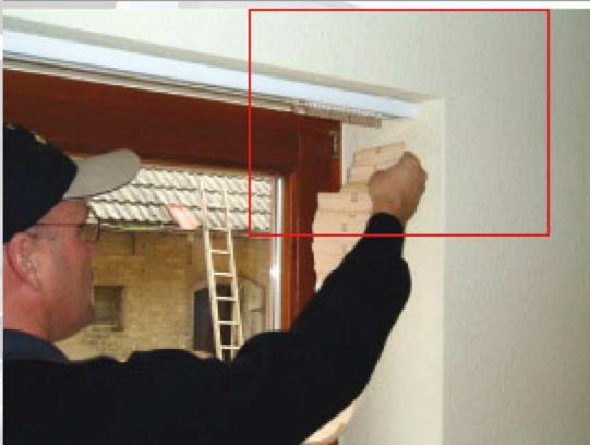
Abb. 8: Die Haken ausrichten

← Das Stoffpaket vor der Montage von der Verpackung befreien.