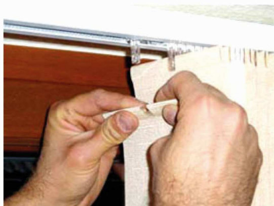
Abb. 14: ... und herausziehen