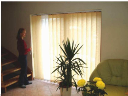
Abb. 12: Das Ergebnis

⇐ Die Abstandskette wird auf beiden Seiten der Beschwerungsplatten eingeklickt.