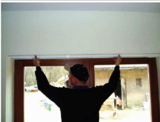
Abb. 6: Schienen in die Clips einsetzen