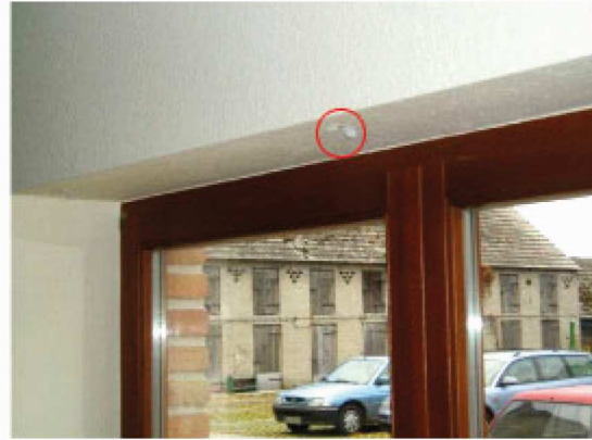
Abb. 5: Clips in die Laibung setzen