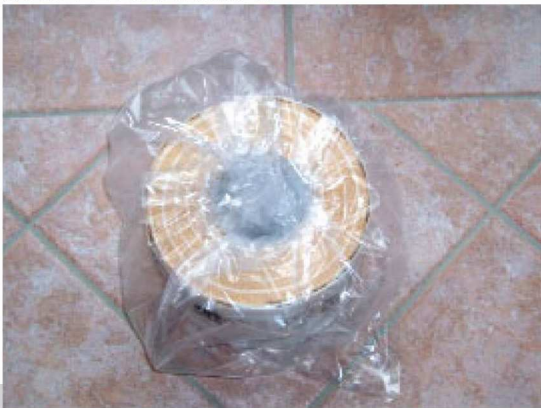
Abb. 7: Das Stoffpaket in Schutzhülle

← Die Schiene wird angekippt, einseitig in die Clips eingesetzt und dann eingerastet.