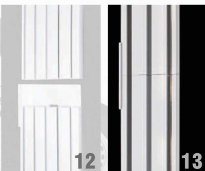
Abb. 12, 13:

Schieben Sie die unteren Beschwerungsstäbe ein und richten Sie die Paneele aus.